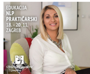
EDUKACIJA NLP PRAKTIČARSKI 18. - 20. 11. ZAGREB