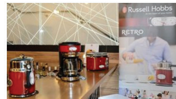
Russell Hobbs predstavio inovacije na proizvodima za pripremu hrane