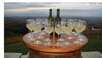
Najveća martinjska fešta u vinariji Kutjevo