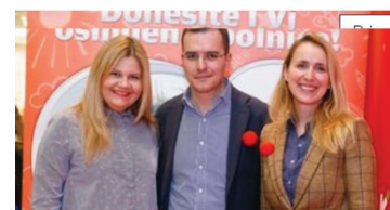
Akcija "Donesite i vi osmijeh u bolnice" ove godine za djecu u Osijeku, Vinkovcima i Vukovaru